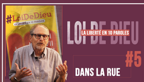
#5 "DANS LA RUE