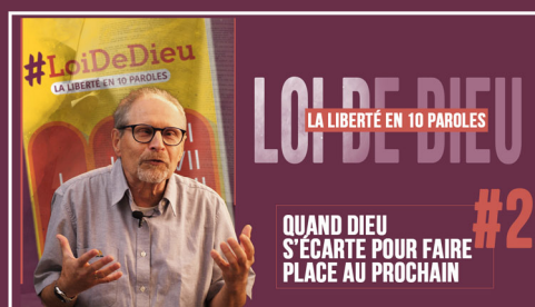
#2 "QUAND DIEU S'ÉCARTE POUR FAIRE PLACE AU PROCHAIN"