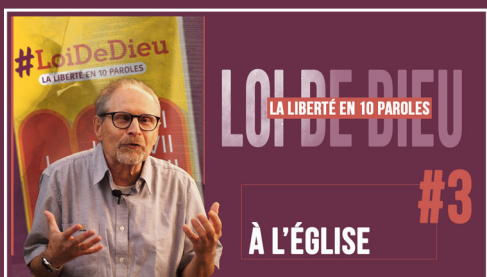
#3 "A L'EGLISE"