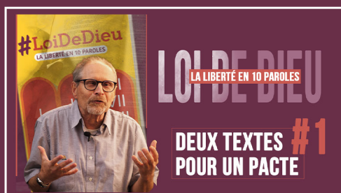
#1 "DEUX TEXTES POUR UN PACTE"

Cliquez sur la vignette pour voir la conférence