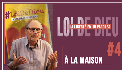
#4 "A LA MAISON"