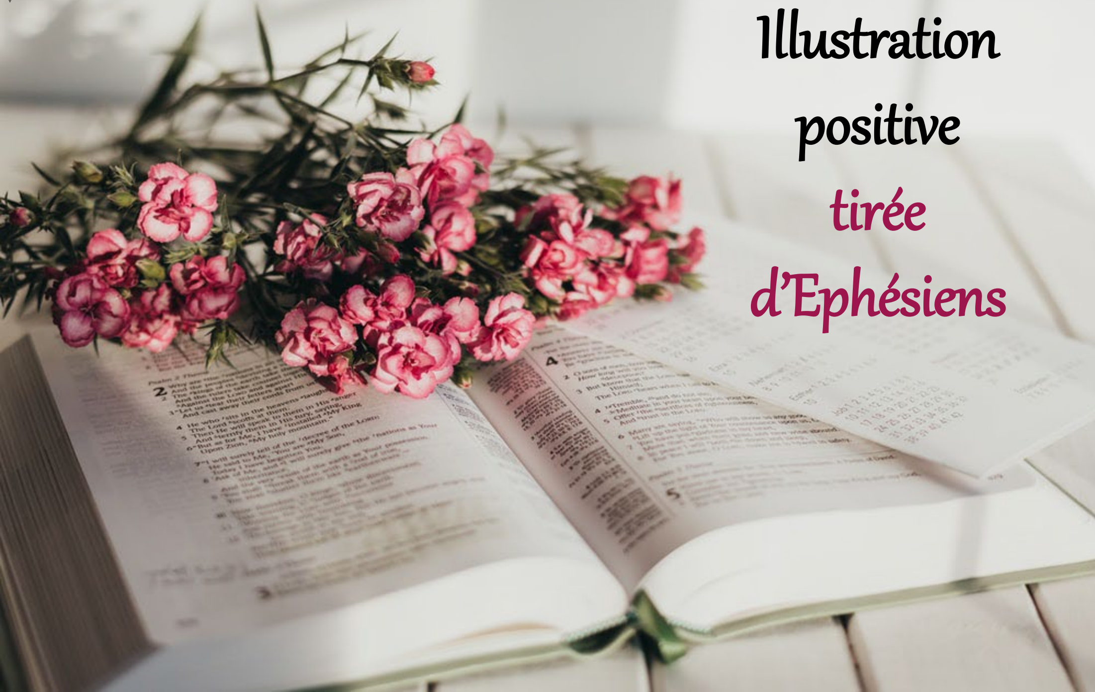
Illustration positive tirée d'Ephésiens